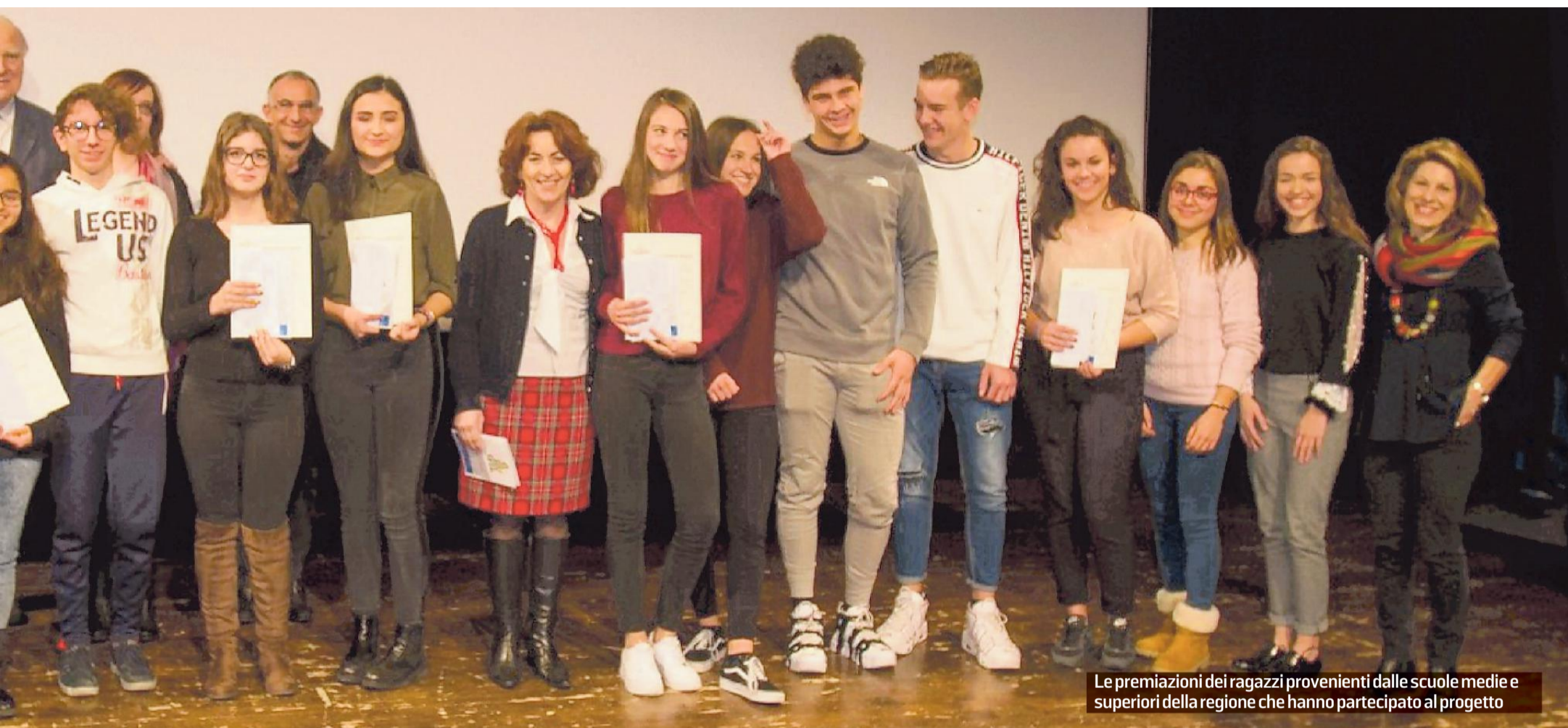
Le premiazioni dei ragazzi provenienti dalle scuole medie e superiori della regione che hanno partecipato al progetto