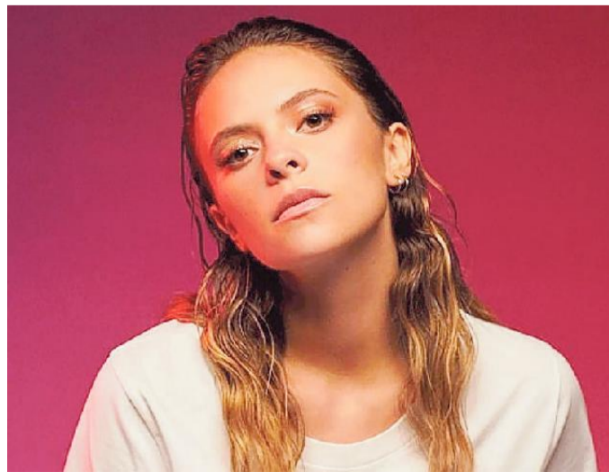
Francesca Michielin, giovane cantautrice e ora anche scrittrice

La cantante ha presentato il suo libro all'auditorium di San Vito al Tagliamento «È importante avere a fianco qualcuno che ti supporti senza pretendere nulla»