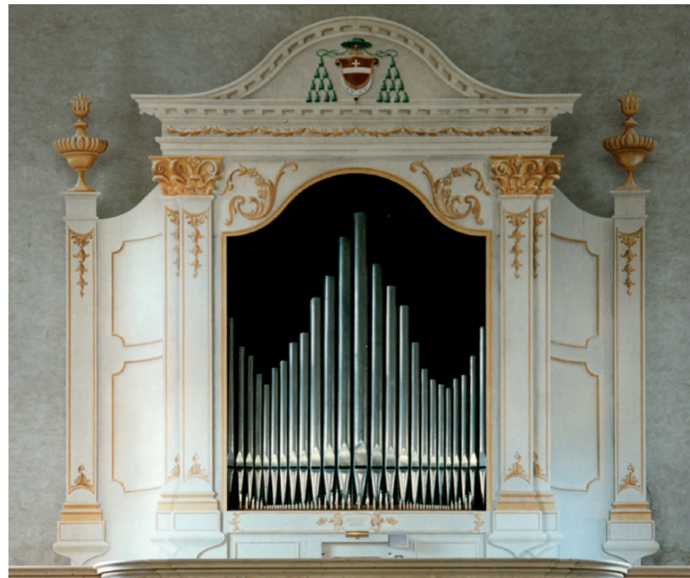
Organo di Gaetano Callido dell'anno 1792, restaurato dalla ditta Zanin di Codroipo