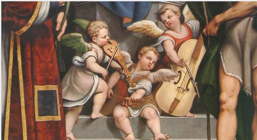
Immagine tratta dalla pala d'altare di Pomponio Amalteo, La Vergine in trono tra i santi Stefano e Giovanni Battista, nella pieve di Cesclans (UD), 1536.

Image taken from the altarpiece by Pomponio Amalteo, The Virgin enthroned between St. Stephen and St. John the Baptist, in the parish in Cesclans (UD), Italy, 1536