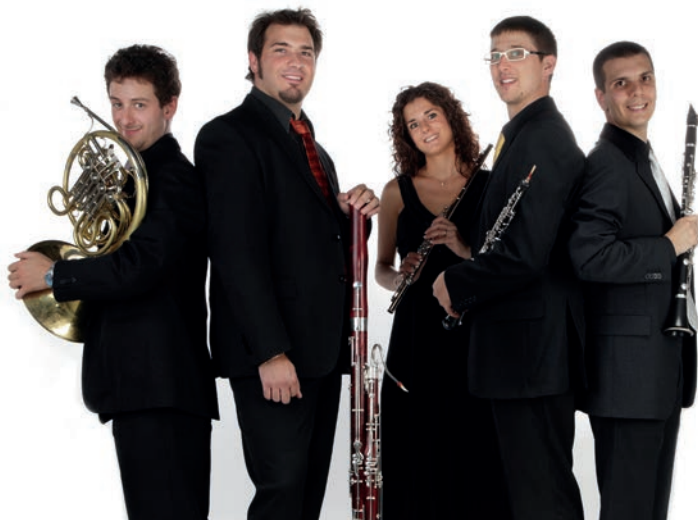
Il Quintetto di fiati Anemos Wind Quintet The Wind Quintet Anemos Wind Quintet